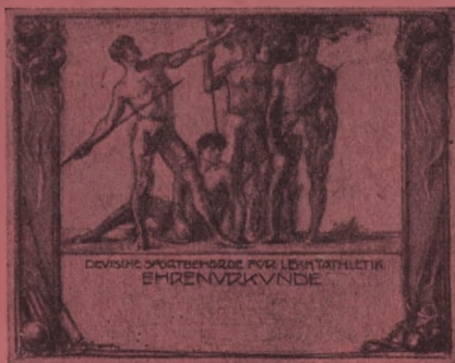
Speerwerfer, Nr. 104 (2-farb.) Größe 18×22 cm, Mk. -.50 Entwurf L. Angerer, München.

Die nachstehend abgebildeten Entwürfe wurden auf Grund eines Preisausschreibens des DSB. von dem hierfür eingesetzten Preisgericht durch Preise ausgezeichnet.