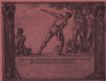
Diskuswerfer, Nr. 105 (2-farb.) Größe 18×22 cm, Mk. -.50 Entwurf: L. Angerer, München.